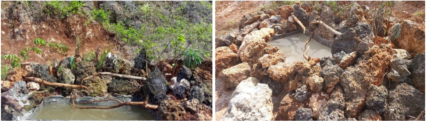
Gambar 3 Contoh unit kolam minum fauna ‘ Faunal Drink Dispenser ’ (FDD) yang dibuat di area green belt tambang batu gamping ( View Point )

Setelah pengecekan awal, kolam dikeringkan dan diisi dengan air baru. Mengingat bahwa disekitar lokasi pembuatan kolam tidak terdapat sumber air, maka pengisian kolam menggunakan air PDAM dari tandon yang berada di area pabrik. Air tersebut juga selama ini digunakan sebagai sumber air bersih disekitar pabrik, sehingga diasumsikan aman digunakan sebagai pengisi kolam FDD. Selanjutnya, secara berkala dilakukan pengecekan setiap satu kali dalam satu minggu untuk memastikan bahwa kolam tetap tidak mengalami kebocoran. Pada saat pengecekan juga dilakukan penambahan dan/atau penggantian air kolam.