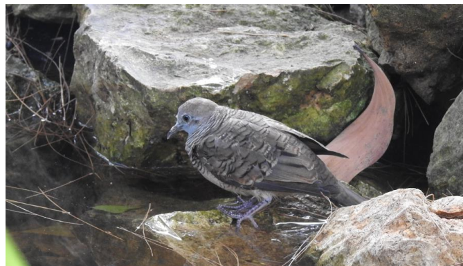
Gambar 5. Burung Perkutut Jawa ( Geopelia striata ) yang memanfaatkan kolam FDD sebagai sumber air minum dan untuk mandi