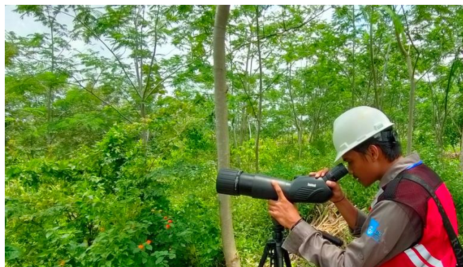
Gambar 2 Pengamatan fauna burung dengan alat bantu teropong monokuler di green belt tambang batu gamping

Pengamatan fauna dilakukan sebelum pembuatan (Juni 2021) dan setelah pembuatan kolam FDD (Juni 2022) untuk mengevaluasi efektivitas kolam tersebut dalam menarik kedatangan fauna. Pengamatan fauna di lokasi sekitar pembuatan kolam FDD menggunakan metode titik hitung ( point count ) [3] . Pengamatan dilakukan pada pagi hari (sekitar pukul 08.00-10.00 WIB) yang mana diperkirakan merupakan waktu aktif bagi fauna diurnal untuk beraktivitas [4] . Pengamatan juga dilaksanakan saat malam hari (pukul 19.00-21.00 WIB) yang merupakan waktu aktif bagi fauna nokturnal [4] . Identifikasi fauna menggunakan literatur [5] [6] [7] [8] dan literatur lain yang representatif. Data yang diperoleh berupa data kualitatif komposisi spesies fauna serta data kuantitatif berupa kelimpahan individu, jumlah spesies dan nilai indeks keanekaragaman Shannon-Wiener ( H' ) [9] yang umum diaplikasikan dalam banyak studi untuk menentukan tingkat keanekaragaman suatu komunitas dalam suatu habitat atau ekosistem.